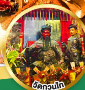
วัดกวนโก