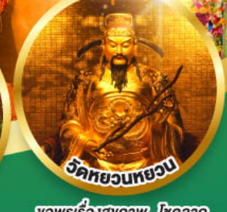
วัดหยวนทวย

ขอพรเรื่องสุขภาพ, โชคลาภ ความเจริญก้าวหน้า