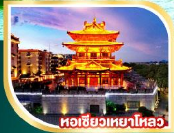
หอเซียวเหยาไหล