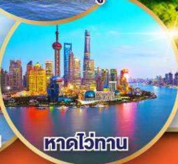
หาดไว่ทาน