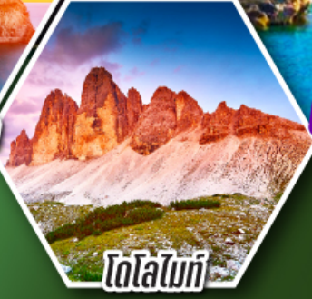
โดโลไมท์

โปรแกรมเดียว เก็บครบจบ อิตาลี ตั้งแต่เหนือถึงใต้