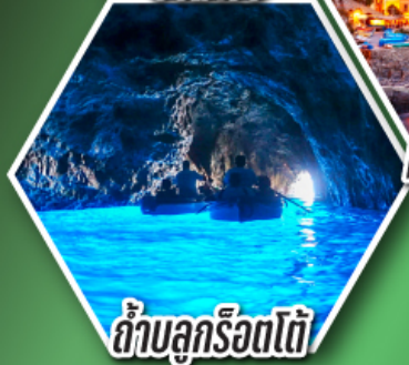
ถ้ำบลูริอตโต้