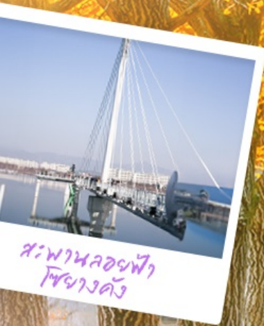
สะพานลอยฟ้า โซฮางคัง