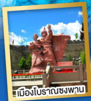
เมืองโบราณชงวาน