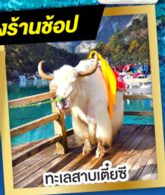
ทะเลสาบเตี้ยซี