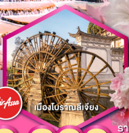
เมืองโบราณลีเจียง