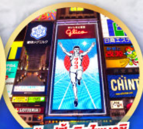
ช้อปปิ้งชินโซบาชิ

เดินทาง 14-19, 21-26 ม.ค. 68 06-11, 13-18 ก.พ. 68 13-18 มี.ค. 68