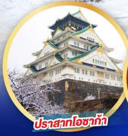
ปราสาทโอซาก้า