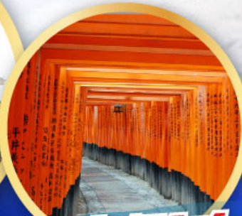
ศาลเจ้าฟูชิมิ อินาริ