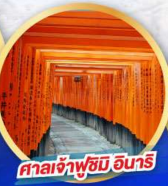
ศาลเจ้าฟูชิมิ อินาริ