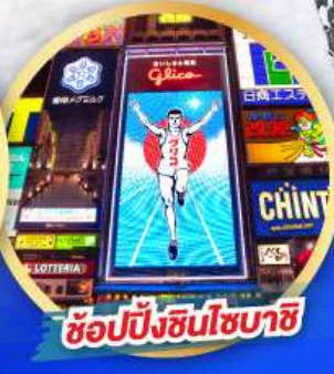
ช้อปปิ้งชินโซบาชิ

เดินทาง 14-19, 21-26 ม.ค. 68 06-11, 13-18 ก.พ. 68 13-18 มี.ค. 68