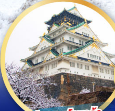
ปราสาทโอซาก้า