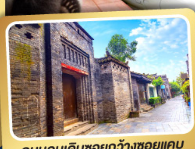
ถนนคนเดินชอยกว้างชวยแคบ