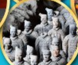
กองทัพ ทหารดินเผา จีนซี