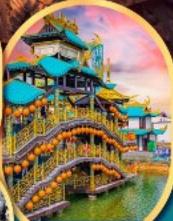
เขาว่านชู่ชาน นครจอมยุทธ