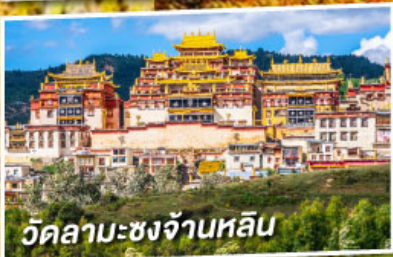
วัดลามะซงจ้านหลิน