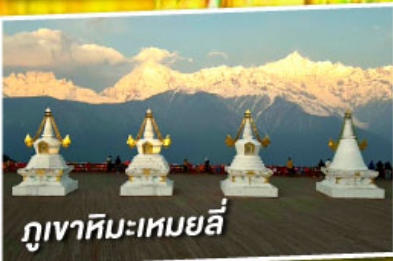
ภูเขาหิมะเหมยลี่