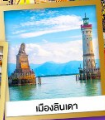
เมืองลินเคา