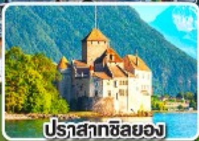
ปราสาทซิลยอง

ฟรี ประกันสุขภาพ และอุบัติเหตุ 3 ล้านบาท คืนทองสูงสุด * ครอบคลุมในไทยและต่างประเทศ ** ครอบคลุมในไทยและต่างประเทศ