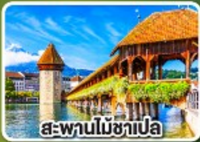
สะพานไม้อาเปลา