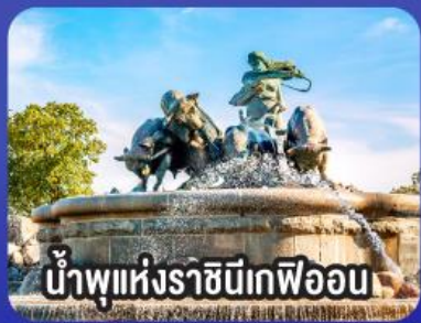
น้ำพุแห่งราชินีเคฟออน