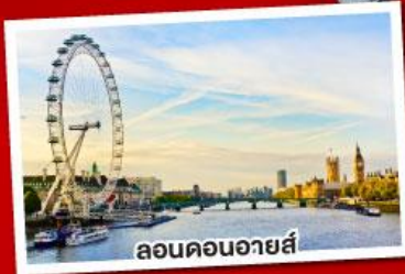
ลอนดอนอายส์