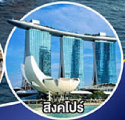
สิงคโปร์