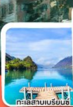
ทะเลสาบเบเรียนซ์

การันตีได้ค้ำคินบน ยอดเขาริเกิ ราชินีแห่งขุนเขาสวิส.