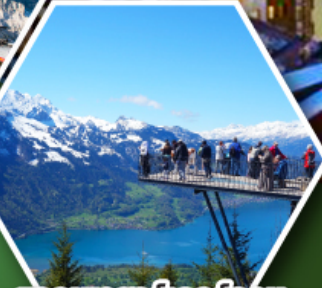
ยอดเขาฮาร์เดอร์คูลม

พักเมืองเซอร์แมท เมืองตากอากาศระดับโลก ที่มีฉากหลังเป็นยอดเขามัตเตอร์ฮอร์น