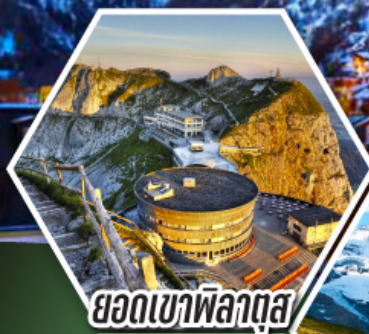
ยอดเขาพิลาตุส