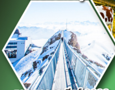
ยอดเขากลาเซียร์ 3000