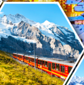
ยอดเขาจุงเฟรา