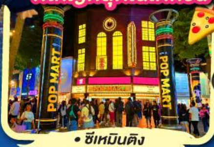
ซีเหมินติง