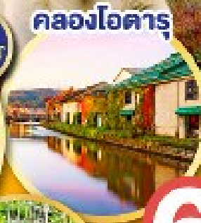
คลองโอดารุ