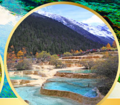
อุทยานหลงหลง