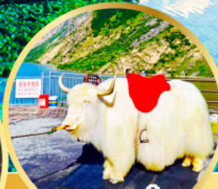
ทะเลสาปเตี้ยซี