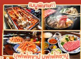
บุฟเฟ่ต์ญี่ปุ่น สเต็กคินโงะ สเต็กคินโงะ สเต็กคินโงะ