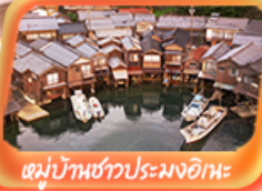
หมู่บ้านชาวประมงอิเะ