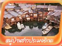
หมู่บ้านชาวประมงอิเกะ