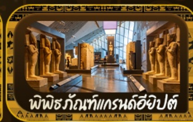
พีพีธกรันท์แกรนด์อียิปต์