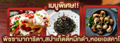
เบčuพิเศษ!! พิชชามากริตา, สปปาเก็ดตีหมักดำ, หอยเอสคาโก