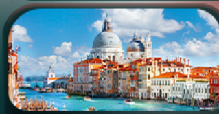
เวนิสเมืองแห่งสายน้ำ