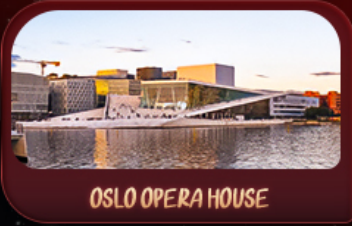
OSLO OPERA HOUSE