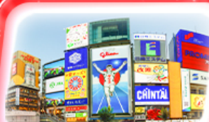
ช้อปปิ้งย่านชินไซบาชิ