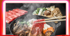
เต็มอิ่ม บุฟเฟ่ต์ชาบูญี่ปุ่น