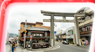
ถนนซาซิมิ