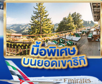
มือพิศข บนยอดเขารัก