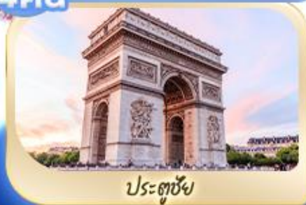
ประตูชัย