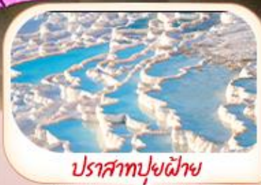
ปราสาทปุยฝ้าย