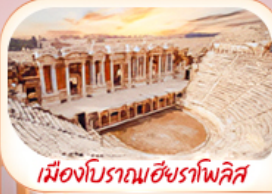
เมืองโบราณฮิราโกลิส