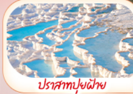
ปราสาทปุยฝ้าย