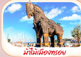
ม้าไม้เมืองทรอย