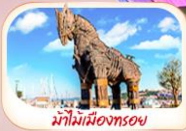
ม้าไม้เมืองทรอย