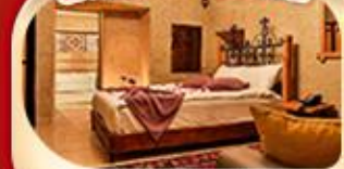
คัปปาโดเกีย