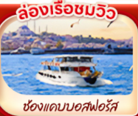
ล่องเรือชมวิว