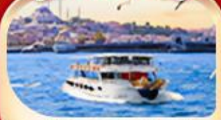
ช่องแคบบอสฟอรัส