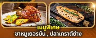
เมนูพิเศษ ขาคูเยอรมัน , ปลาเทราต์ย่าง

แถมฟรี! น้ำดื่ม 1 ขวดทุกวัน, ปลั๊กไฟยูนิเวอร์แซล