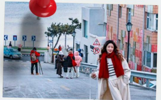
ถนนฮั่วจวีปา