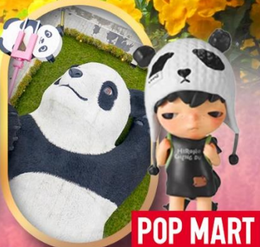
POP MART หมีแพนด้าเซลฟ์