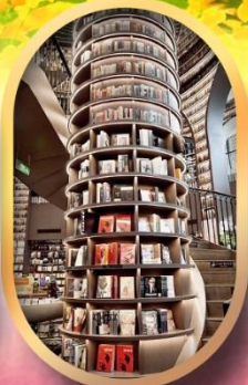
อุทยานปีติงโกว