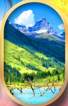
อุทยานสีดรุณี