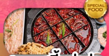
มือพิเศษ สุกี้หม่าล่า