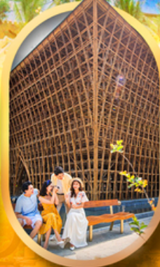
อาคารไม้ไฟ