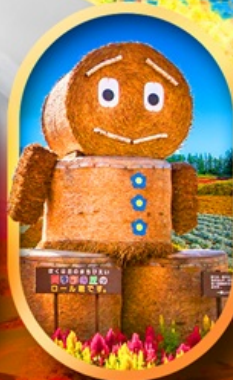
ซิกิโซ โนะโอะกะ