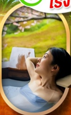
แช่บ่อนอนเซ็นญี่ปุ่น