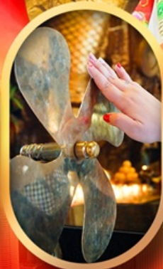
หมอนกั๊กหันแซง