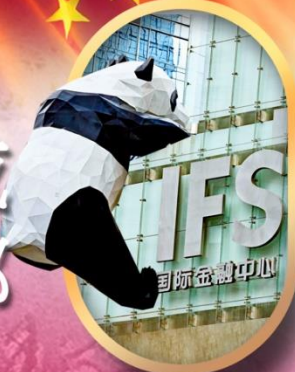
IFS หนีแพนด้าป็นตึก