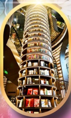
หอหนังสือจงซูเก๋อ