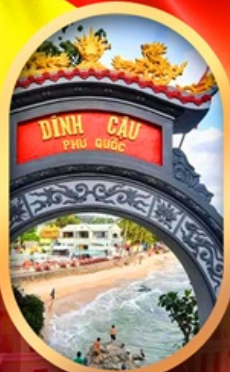
ศาลเจ้าติงเกา