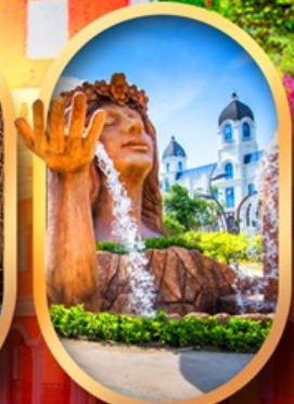
น้ำตกเทพพิหลิง