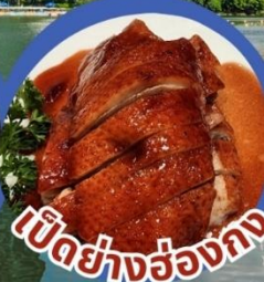
เป็ดย่างฮ่องกง