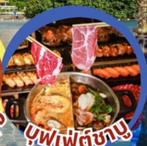
บุฟเฟ่ต์ชาบู