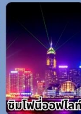
ชมไฟนีออนไฟรี่