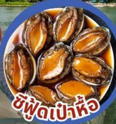
ซีฟู้ดเป้าหื้อ