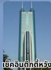
เซ็คอินตึกตีห้วง