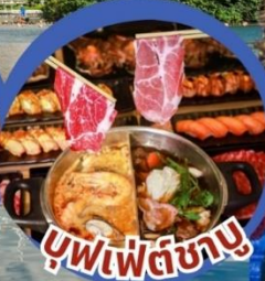
บุฟเฟ่ต์ชาบู