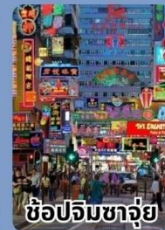
ช้อปปิ้งซาจ่วย