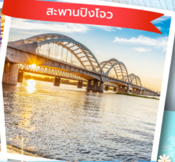
สะพานปิงโจว