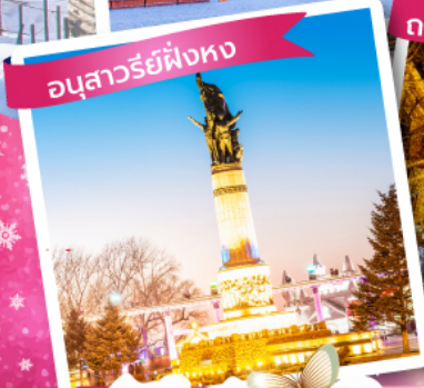
อนุสาวรีย์ฟิ่งทง