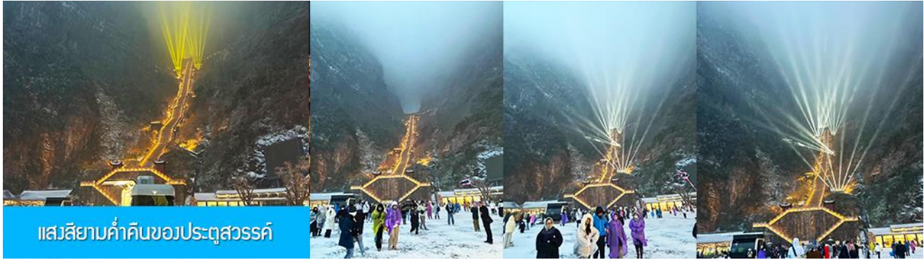
แสลลิยามค่าคีนของประตูลีสวรรค์

บันไดเลื่อนรวมอยู่ในตั๋วแล้ว) 999 ขึ้น ณ ลานกว้างด้านล่างเป็นจุดถ่ายรูปที่ดีที่สุดที่สามารถมองเห็นเขาประตูลี สวรรค์ได้อย่างชัดเจน