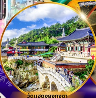
วัดแฮดงยงกุงซา