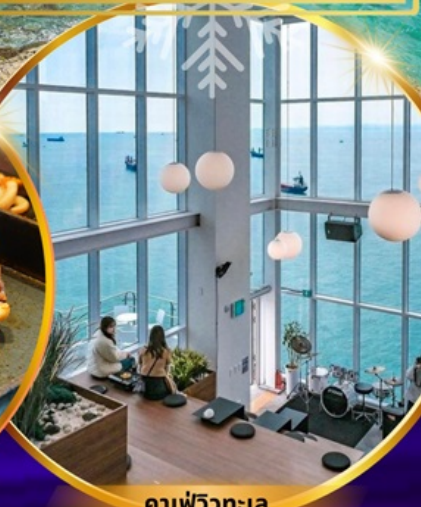
คาเฟ่วิวทะเล

ถ่ายรูปชิคๆ หมู่บ้านวัฒนธรรมคัมซอน เชคอิน คาเฟ่ริมทะเล วิวหลักล้าน ขึ้นเคเบิลคาร์ ชมทะเลปูซาน นั่งรถไฟปิ๊กปิ๊ก sky capsule ห้ามพลาด!! ตลาดปลาที่ใหญ่ที่สุด ชิมของอร่อยที่ตลาดแฮอุนแด อิสระช้อปปิ้ง Lotte Duty Free