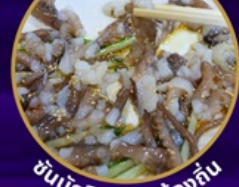
ซันนั๊กจิ อาหารท้องถิ่น