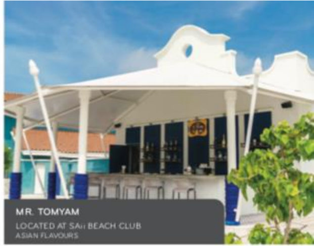
MR. TOMYAM LOCATED AT SAJI BEACH CLUB ASIAN FLAVOURS