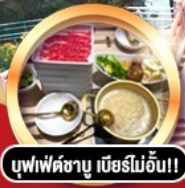
บุฟเฟ่ต์ชาบู เมื่อบริไม้อัน!!