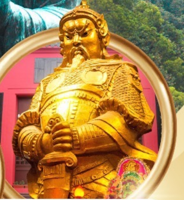
วัดเขangkงมี้ว