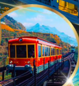
รถราง ซาปา