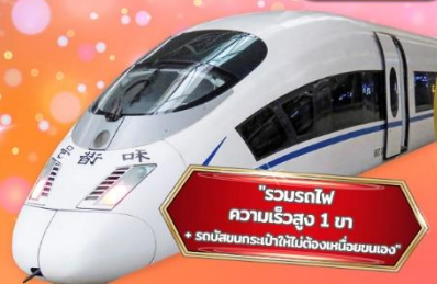
"รวมรถไฟ ความเร็วสูง 1 ขา + รถบัสชมธรรมชาติในท้องถิ่นพร้อมคนเฝ้า"