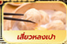
เสี่ยวหลงเปา