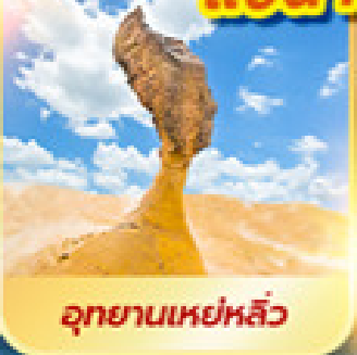
อุทยานเหย่หลิว

เที่ยวเต็ม!! ไม่มีวันอิสระ แช่น้ำแร่ในห้องพักส่วนตัว