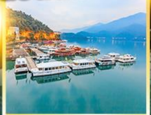
ทะเลสาบสุริยันจันทรา