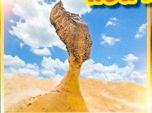
อุทยานเหย่หลิว

เที่ยวเต็ม!! 14 มิถุนายนอิสระ แช่น้ำแร่ในห้องพักส่วนตัว