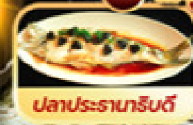
ปลาประธาราหรับดี