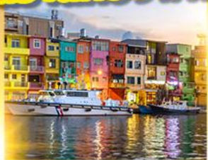
หมู่บ้านประมงเจิ้งปิน