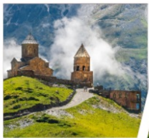
โบสถ์เกอร์เกติ