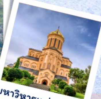
มหาวิหารแห่งทบิลีซี