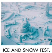
ICE AND SNOW FEST.

ฟรี!! ...ถุงมือ ผ้าพันคอ หมวก ท่านละ 1 ชุด