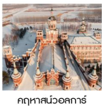
คฤหาสน์วอลการ์