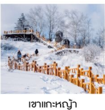
เขาแคะหลัว