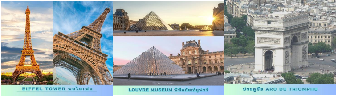
EIFFEL TOWER หอไอเฟล